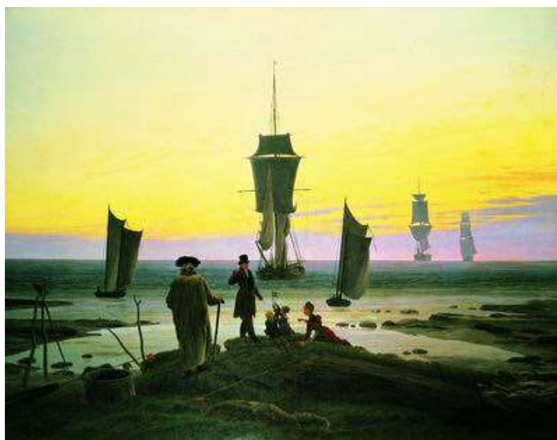
Возрасты человека. 1834—1835

Патриотические ноты звучат в раннем полотне «Охотник в лесу» (1813—1814, частное собрание). Маленькая фигурка французского охотника на фоне заснеженного прусского леса символизирует образ пришельца-завоевателя.