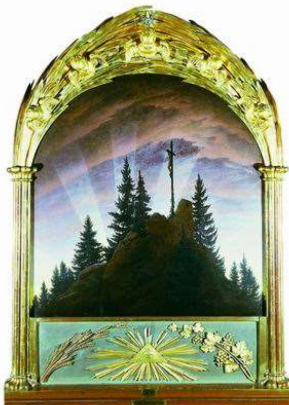
Крест в горах (Тетченский алтарь). 1807—1808

Фридрих изучал искусство рисунка в университете Грейфсвальда, затем занимался в Академии художеств Копенгагена, где сформировался как живописец-пейзажист. С 1798 года он работал в Дрездене, где сблизился с кружком писателей-романтиков — Л. Тиком, Новалисом, Г.Ф. Клейстом — оказавшим значительное влияние на художника. В поисках природы он много путешествовал по побережью Балтийского моря, в горах Ризенгебирге. «Землей души», по словам художника, стал для него остров Рюген в Балтийском море, где он подолгу жил и работал. Но писать маслом Фридрих начал поздно, лишь в 1807 году.