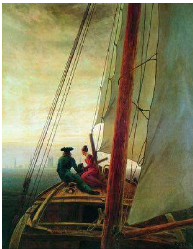
На парусном корабле. 1817—1818

романтическом периоде его творчества ("Руины в Ризенгебирге", 1830—1834, Грейфсвальд, Городской музей). Фридрих по-прежнему часто пишет морские виды, пейзажи острова Рюген и открытые им впервые в 1810 году горы Ризенгебирге, но теперь его чаще привлекают равнинные ландшафты Померании ("Одинокое дерево", 1822, Берлин, Национальная галерея; "Вид Грейфсвальда", 1820—1830, Гамбург, Кунстхалле). Он создает в них менее романтизированные, более приближенные к реальности виды. Значительное время художник уделяет работе в сепии, демонстрируя в рисунках большую свободу в передаче единства света, цвета и воздуха. Программным в творчестве художника явилось его позднее полотно «Возрасты человека» (1834—1835, Лейпциг, Музей изобразительных искусств). Вид побережья Балтийского моря написан в серебристо-серой колористической гамме. Панорама морской дали с парусными лодками открывается от фигур, олицетворяющих три поколения, три этапа человеческой жизни — юность, зрелость и старость. Созерцательный пейзажный мотив приобретает глубокое символическое звучание, поэтически повествуя о жизненном пути человека. Художник-романтик, Фридрих трактует жизнь человека и природы как нечто целое, подвластное проявлениям некой вечной, божественной силы. Романтические ноты вновь прозвучали в этом полотне; Фридрих вновь обратился в нем к теме, всегда остававшейся для него главной.