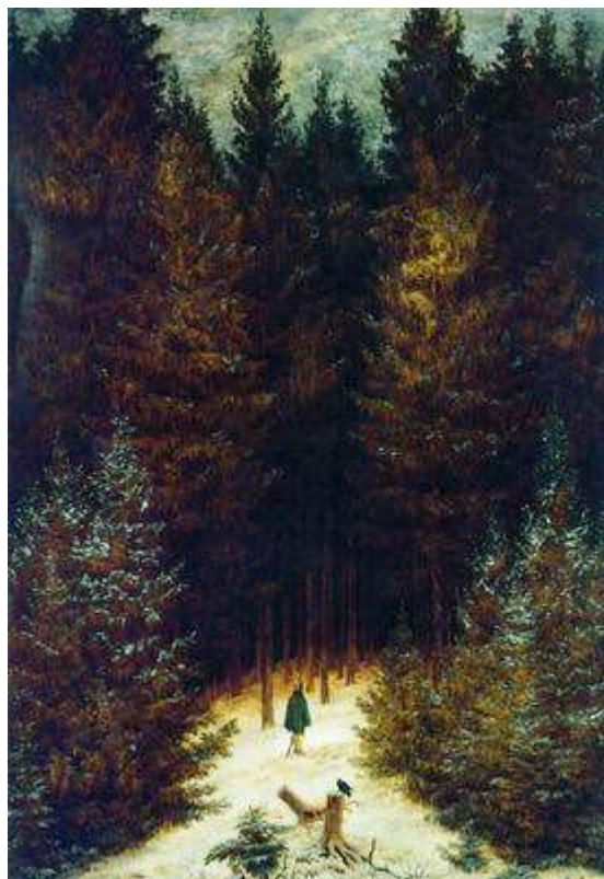
Охотник в лесу. 1813—1814

и безграничного, малого и большого служит вовлечению зрителя в пространство пейзажа. Полотна художника зачаровывают чувством всевластия природы над человеком, грандиозностью вечного движения, происходящего в ней.