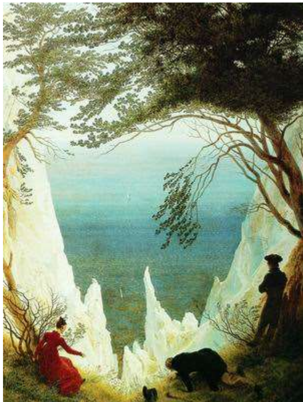
Меловые скалы на острове Рюген. 1818

1808—1810, Берлин, Государственные музеи; "Заброшенное аббатство зимой", 1834; "Собор", ок. 1817, оба — Нюрнберг, Германский национальный музей). Фридрих увлекался архитектурой, занимался реставрацией памятников и поэтому всегда стремился к детальной точности их воспроизведения, делая много зарисовок во время путешествий. Эти возвышающиеся архитектурные постройки, кресты Распятия смотрятся как символы времени, привнося в полотна художника необычность и таинственность.