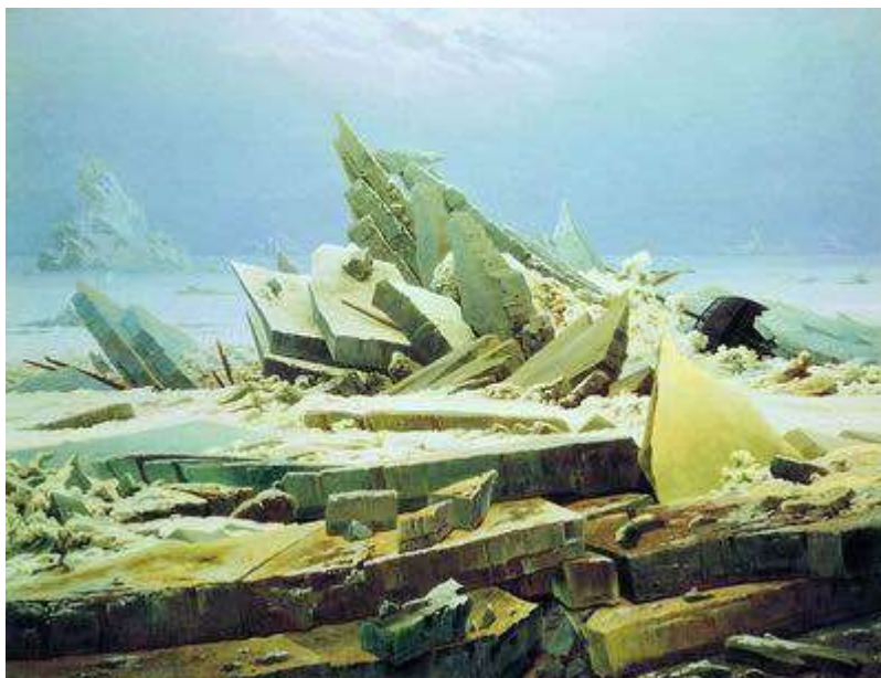
Море во льдах (Гибель «Надежды»). 1824

Пейзажу суждено было играть важную роль в европейской живописи XIX столетия, и творчество Фридриха, одного из самых ярких мастеров романтизма, определило целый этап в развитии жанра, предопределив его последующие достижения в «век реализма».