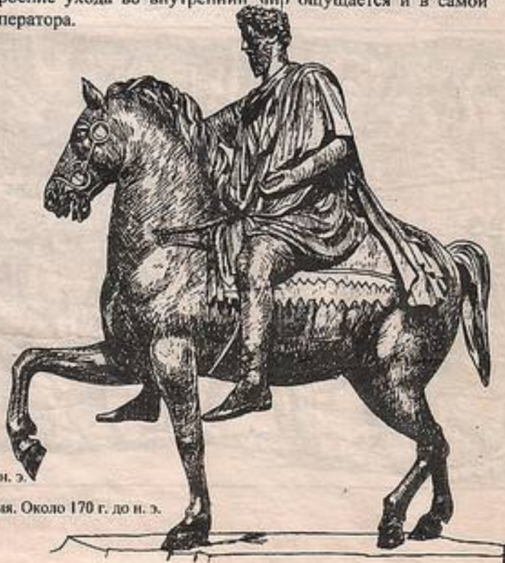
Конная статуя императора Марка Аврелия. Около 170 г. до н. э.