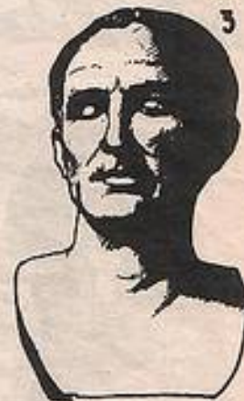
1-Статуя римлянина с бюстами предков; 2-Портрет Помпея; 3 - Бюст Юлия Цезаря;

Видео Ольга Тулушева. Римск скульп портр