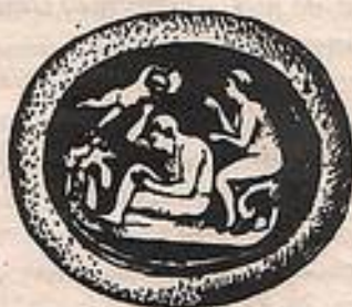
- Геракл у Омфалы. Камень. Оникс . I в. до н. э.

Богатейшей коллекцией произведений глиптики - античных гемм, служивших амулетами, печатями, женскими украшениями - обладает Государственный Эрмитаж. Гемма с врезным изображением называется инталия , а с выпуклым рельефным изображением - камея . Родиной камей считается Александрия в Египте. Именно там была создана в III в. до н. э. одна из самых известных и крупных античных гемм - « Камень Гонзаго », изображающая Птолемея II и его жену Арсиною. Поддаваясь обаянию греческих камей и сохраняя следы эллинистических традиций, римские мастера все же не теряют своей индивидуальности и сохраняют лаконичность и строгость стиля.