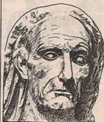
1 - Портрет старого римлянина Мрамор. 80-70 гг. до н.э. 2 - Фрагмент рельефа колонны Траяна.