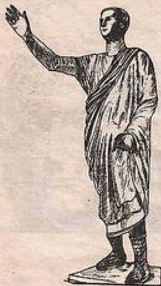
Статуя оратора. Бронза. Около 100 г. до н. э.

В Древнем Риме было около 22 конных монументов, но дошел до нас лишь один - бронзовый конный монумент Марку Аврелию , установленный в XVI в. на Капитолийской площади. А сохранился он потому, что в эпоху средневековья его приняли за статую императора Константина, при котором в 313 г. христианство стало государственной религией Римской империи. Именно эта статуя послужила образцом для конных монументов разных времен и стран. Перед нами император, которого называли философом на троне, хотя он провел большую часть жизни в седле. Он был одним из любимых мыслителей Льва Толстого. В сочинении «Наедине с собой» Марк Аврелий писал: «Время человеческой жизни - миг; ее сущность - вечное течение; ощущение смутно, строение всего тела бrenно; душа неустойчива, судьба загадочна; слава недостоверна». Это настроение ухода во внутренний мир ощущается и в самой фигуре лишенного доспехов императора.