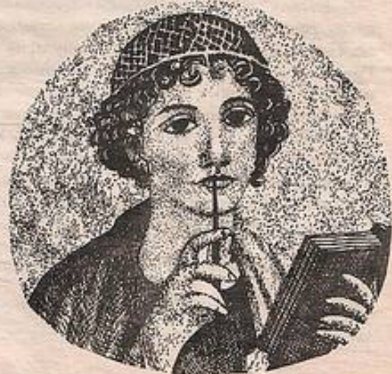
Мозаика из Помпей «Битва Александра Македонского». Фреска из Помпей. Поэтесса.

Стены домов украшались фресками - росписью по сырой штукатурке. Краски готовили из минеральных веществ, а красители получали из растений и животных. Во фресковых росписях Помпей можно увидеть изображения животных и птиц, различных предметов быта, появляются и портретные образы. Во многих сохранившихся портретах, часто вписанных в круг (тондо), римляне изображены задумавшимися или в момент поэтического вдохновения, как, например, живописный портрет поэтессы Санфо .