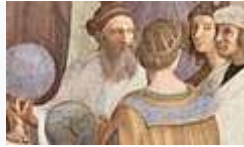
Страбон или Заратустра, Клавдий Птолемей, Рафаэль в образе Апеллеса и Пьетро Перуджино или Тимотео Вити в образе Протогена