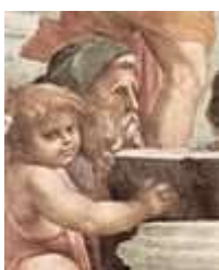
Зенон Китийский или Зенон Элейский