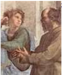
Эсхин и Сократ