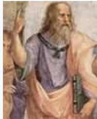
Леонардо да Винчи в образе Платона