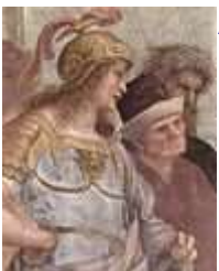
Алкивиад или Александр Македонский и Антисфен или Ксенофонт