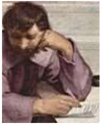
Микеланджело в образе Гераклита Эфесского