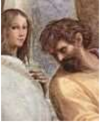
Возлюбленная Рафаэля в образе Гипатии и Парменид