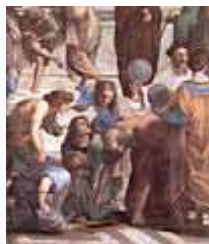
Дonato Браманте в образе Евклида или Архимеда