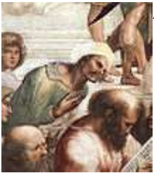
Аверроэс и Пифагор