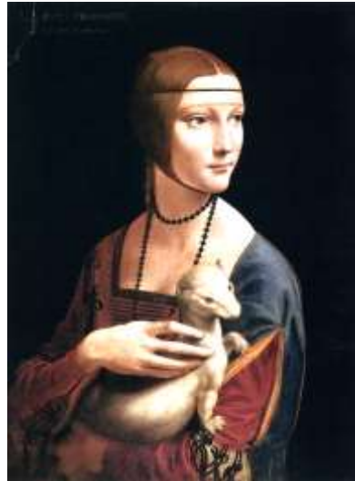
Дама с горностаем