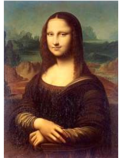
Мона Лиза. Джоконда