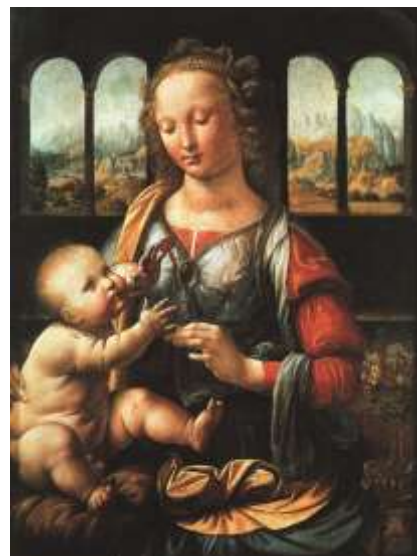
Мадонна с гвоздикой