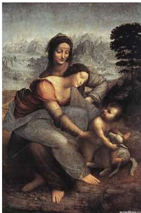
Святая Анна с Марией и младенцем Христом