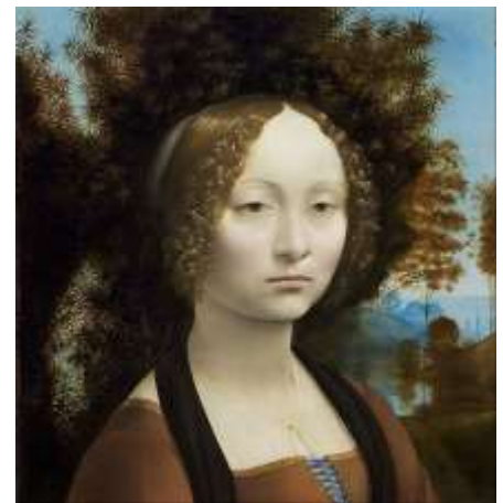
Джинепра де Бенчи