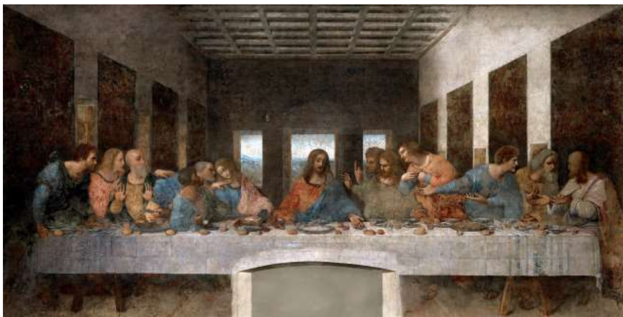
Тайная вечеря (фреска)