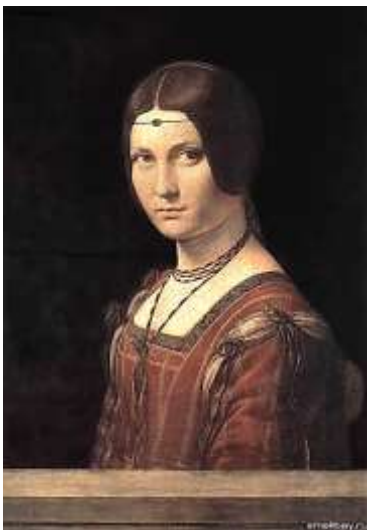
Дама с ферроньеркой