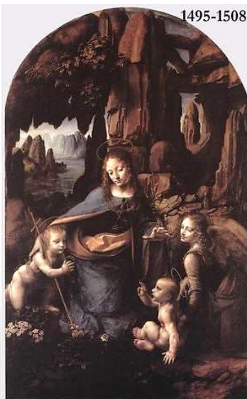
Мадонна в скалах